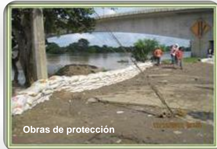
Obras de protección