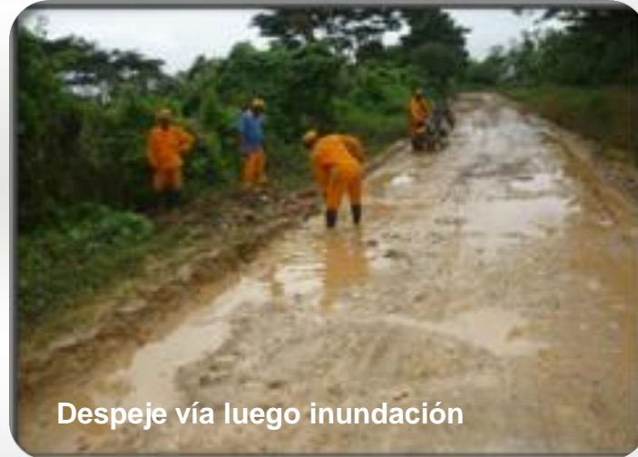
Despeje vía luego inundación

Longitud 12.150 Km. Empleos directos: 3.270 Inversión $97.363 millones